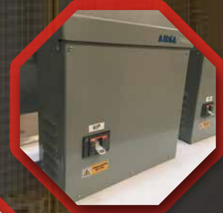
Bancos de capacitores