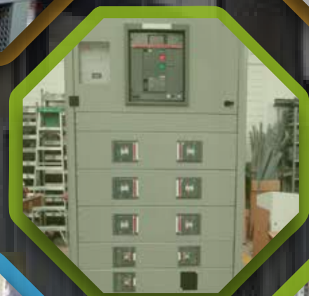
Tableros de distribución