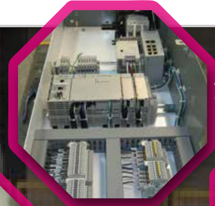
Actualización de equipos